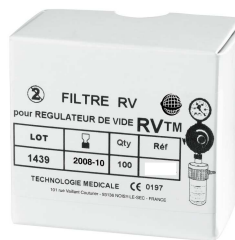
Réf. : 11818 Boîte de 100 filtres papier pour ancien flacon de sécurité du régulateur de vide RVTM