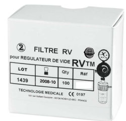
Ref.: 11818 (Box of 100 paper filters for previous safety jar for RVTM vacuum regulator)